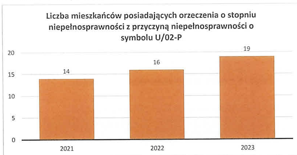
Wykres 5 Liczba mieszkańców posiadających orzeczenia z symbolem U/02P (choroby psychiczne)